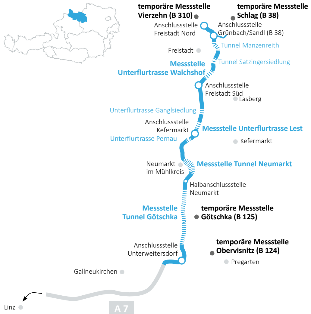
Abbildung 1: Lageplan der S 10 – Mühlviertler Schnellstraße (Abschnitt Süd) sowie der Messstellen zur Verkehrserfassung

Quellen: ASFINAG Bau Management GmbH; Land Oberösterreich; Darstellung: RH