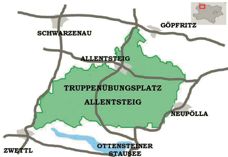
Abbildung 1: Truppenübungsplatz Allentsteig