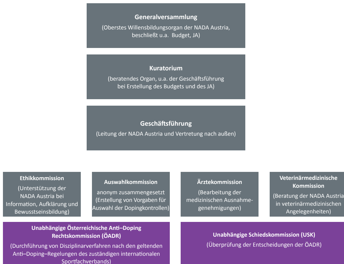
Abbildung 1: Organisation der Anti-Doping-Kontrolle

3 (1) Die folgende Abbildung gibt einen Überblick über die im Gesellschaftsvertrag der NADA Austria angeführten Organe sowie die nach dem ADBG 2007 (durch die NADA Austria) einzurichtenden Kommissionen.