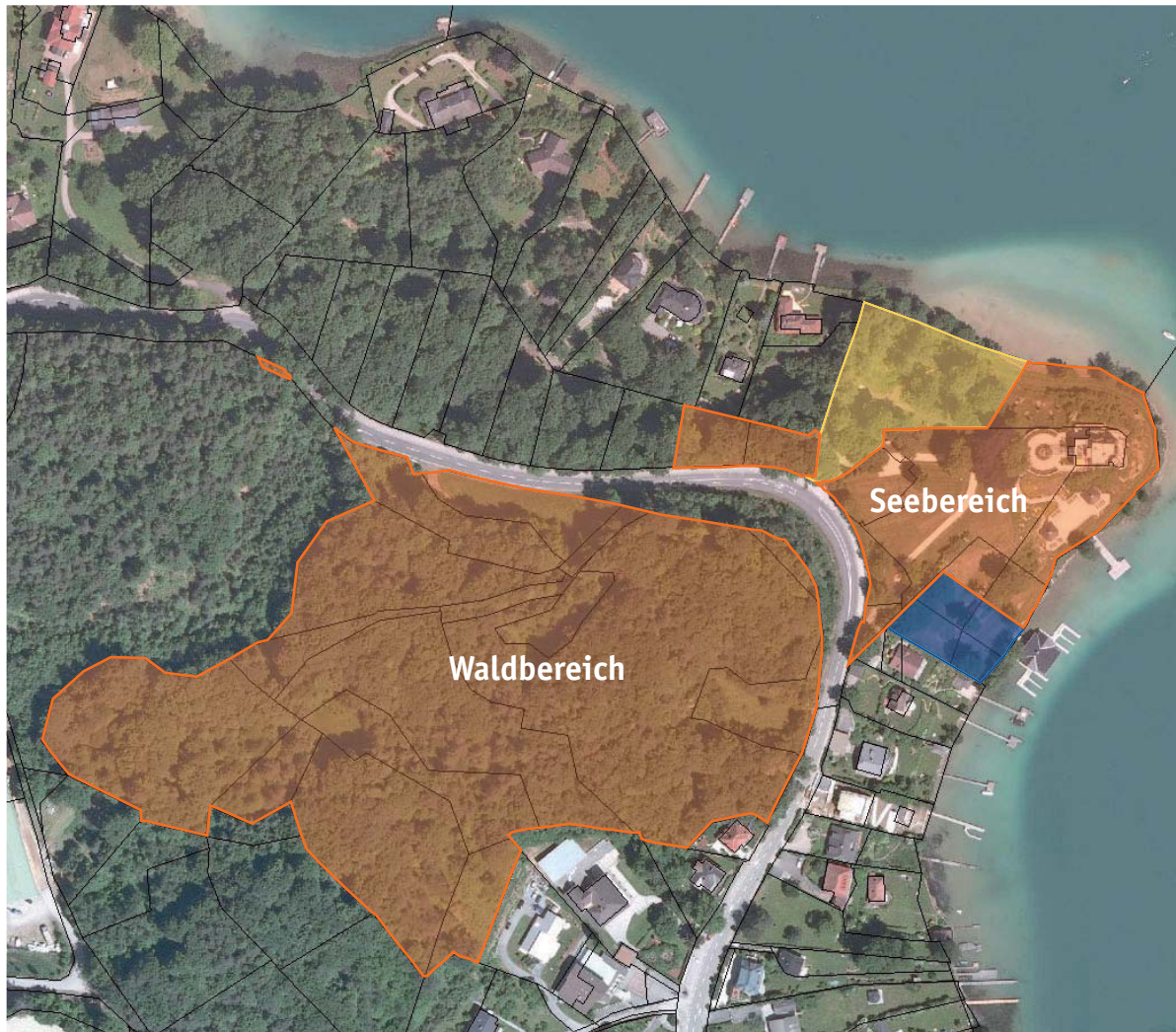
Abbildung 2: Liegenschaft „Schloss Reifnitz“ samt angrenzender Grundstücke mit Kennzeichnung der Verkäufer