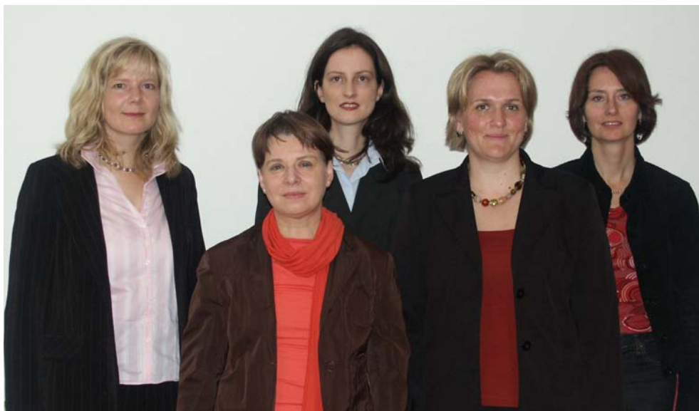
Das Team des Rechnungshofes