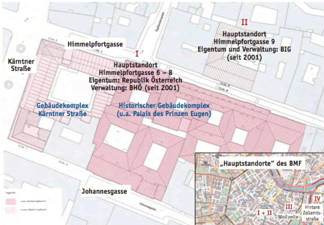
Abbildung 1: „Hauptstandorte“ der Zentralleitung des BMF

Quellen: BMF und BHÖ, eigene Darstellung RH; Stand 2000/2001 Copyright: OpenStreetMap und Mitwirkende, CC-BY-SA